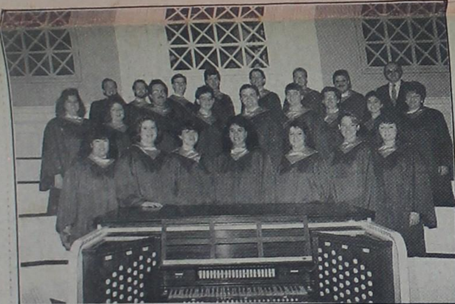
O coro de Kentucky apresenta músicas folclóricas e religiosas americanas durante o simpósio de música