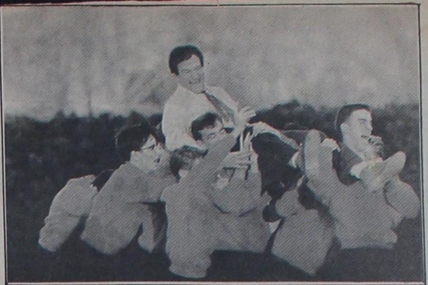
Sociedade dos Poetas Mortos, até quarta