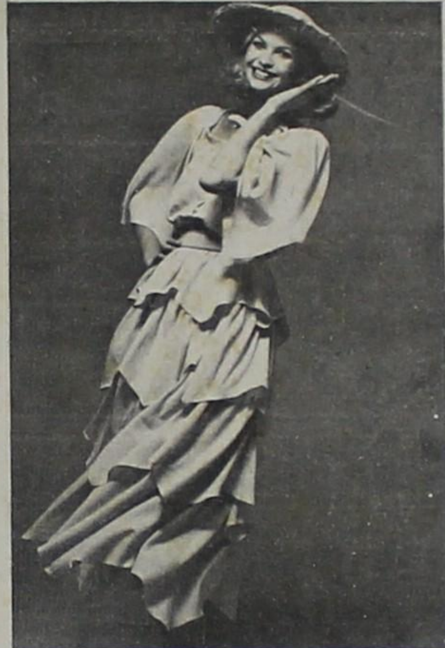
O estilo romântico neste modelo de Ted Lapidus, em crepe indiano, com saia em pontas e mangas soltas e amplas. Chapéu de rafia.