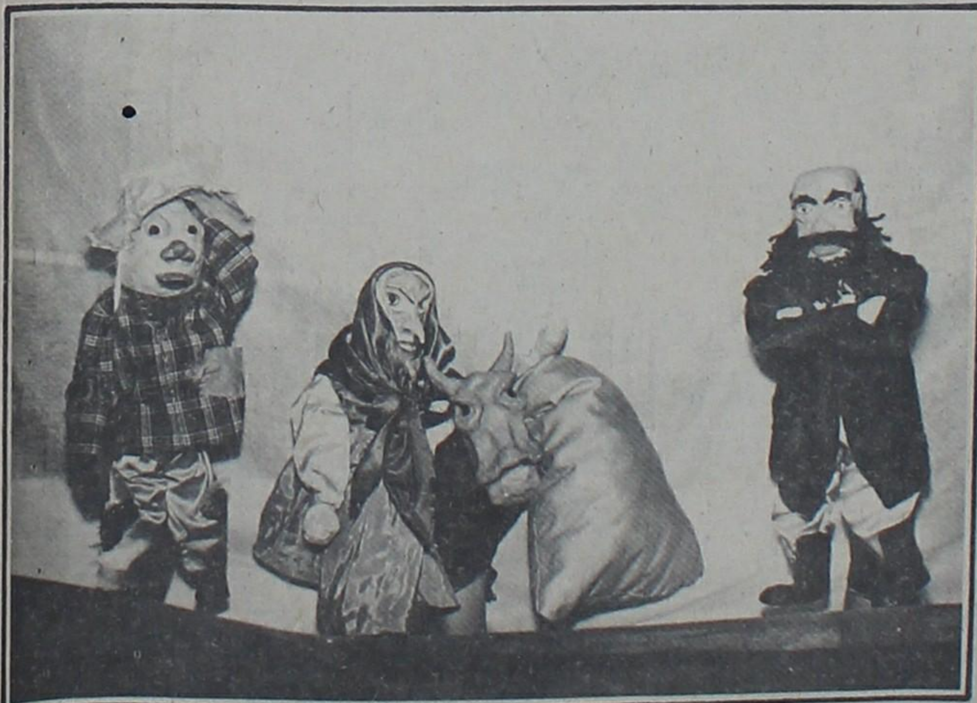
O Grupo Mecenas Troupe Teatro, de Vitória, apresenta um espetáculo com bonecos sobre um migrante em busca de paz