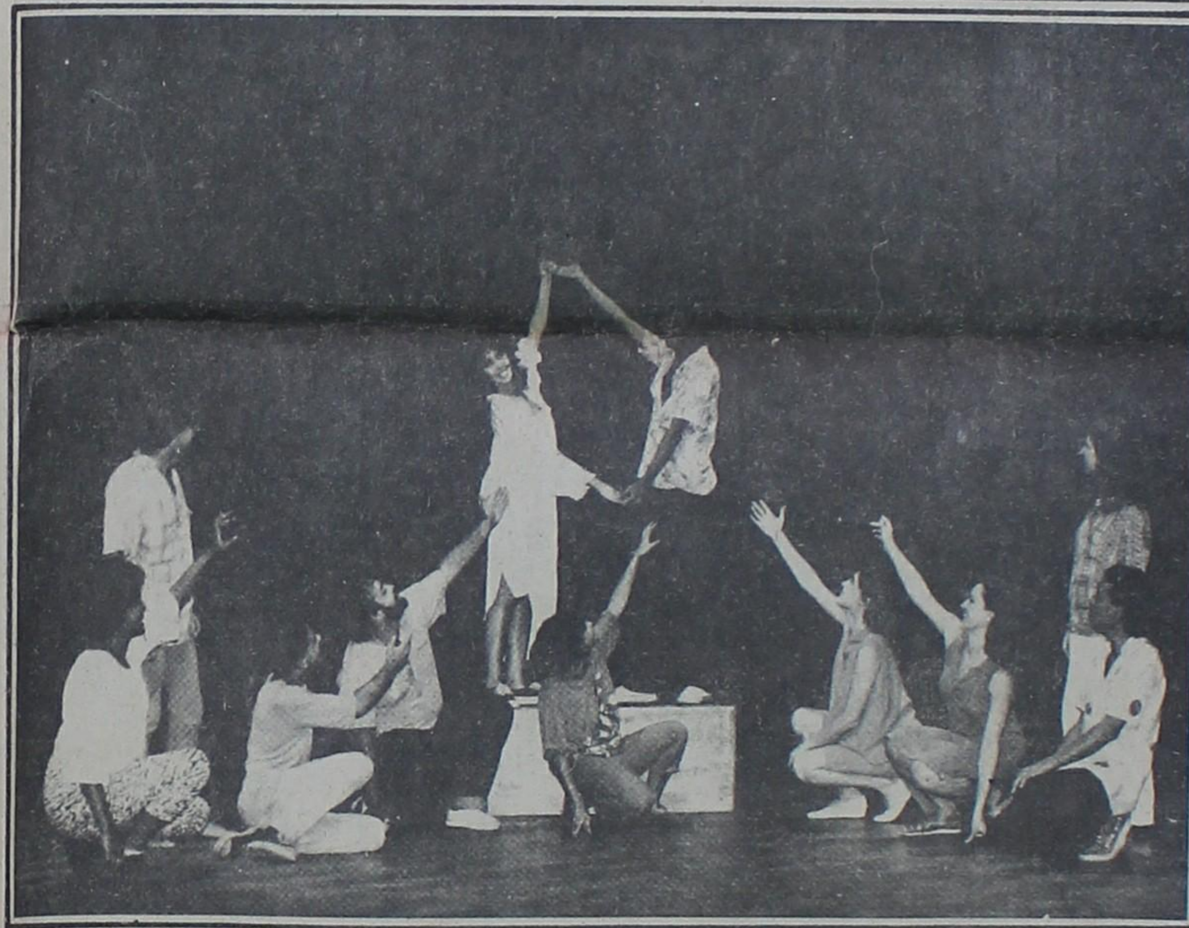
O Delírio do Poder veio de Belo Horizonte e reúne um grupo de jovens

Encerrando o ciclo de painéis promovido paralelamente à Mostra, às 10 horas será realizado um debate sobre a Lei Sarney, com a participação de representantes do Inacen, OAB, DEC e Federação das Indústrias.