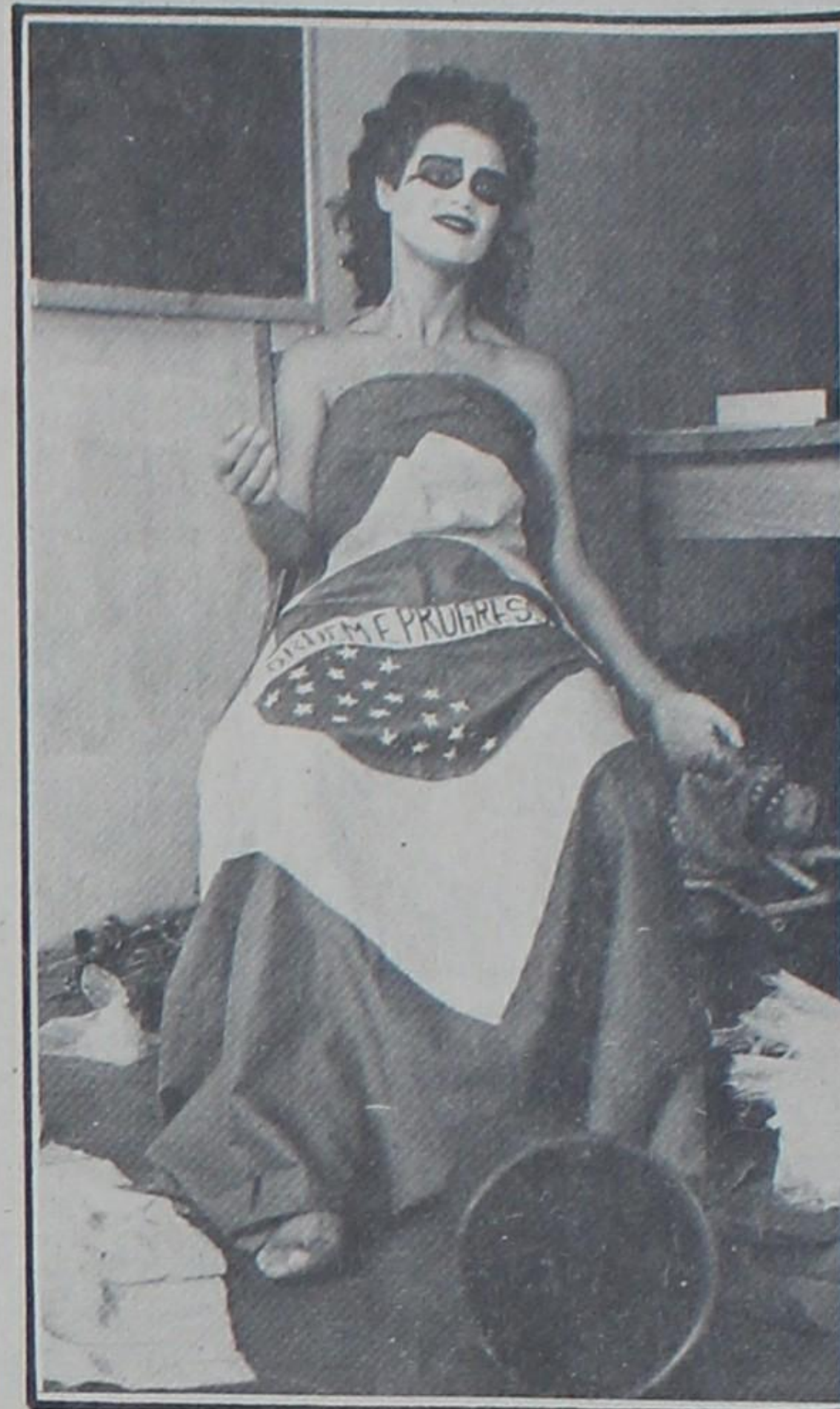
'Apareceu a Margarida', de Ouro Preto (MG)

país. Segundo os seus organizadores, esta também será uma oportunidade dos amadores promoverem "uma avaliação e uma reciclagem dos trabalhos cênicos", além de afirmarem a conscientização do valor cultural das manifestações artísticas nas suas diferentes regiões. Os ingressos para os espetáculos incluídos na mostra estão sendo vendidos a Cz$ 25,00, havendo a distribuição de bônus especiais que permitirão um desconto de Cz$ 10,00 no seu valor.